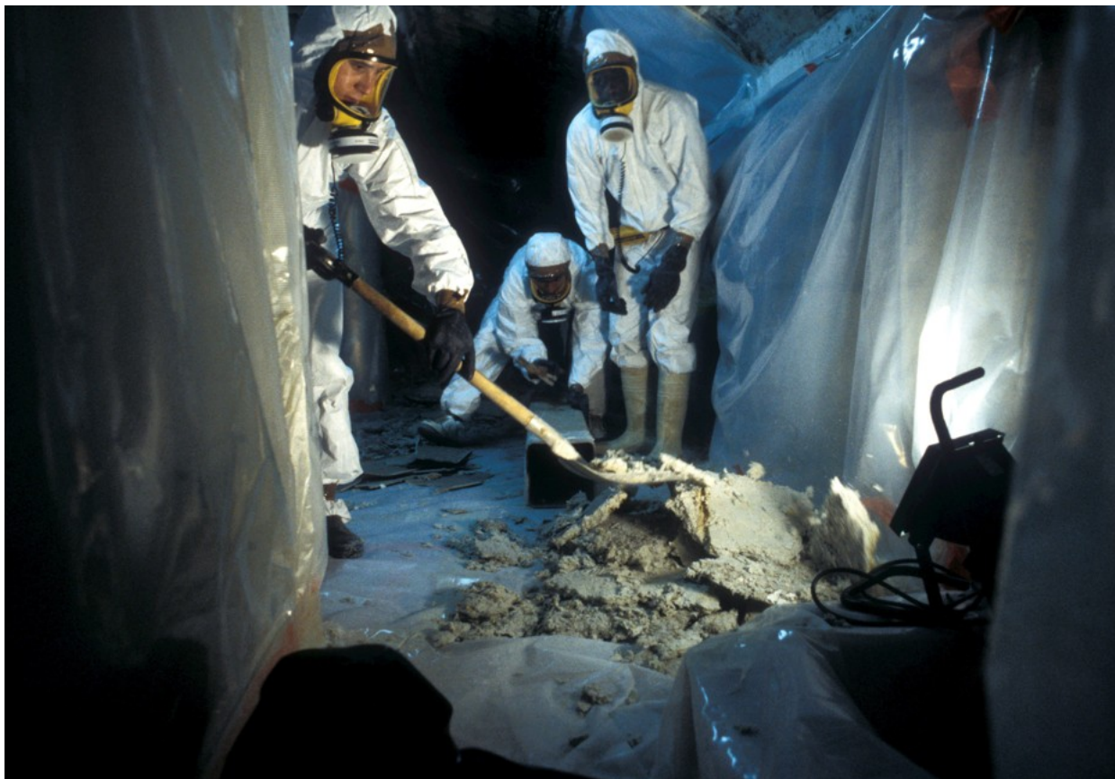
Er is nog minstens 3,7 miljoen ton asbest in omloop in ons land.

Wat? Asbestslachtoffers staan al te vaak voor een pijnlijke keuze: een snelle vergoeding, of een trage zoektocht naar rechtvaardigheid.